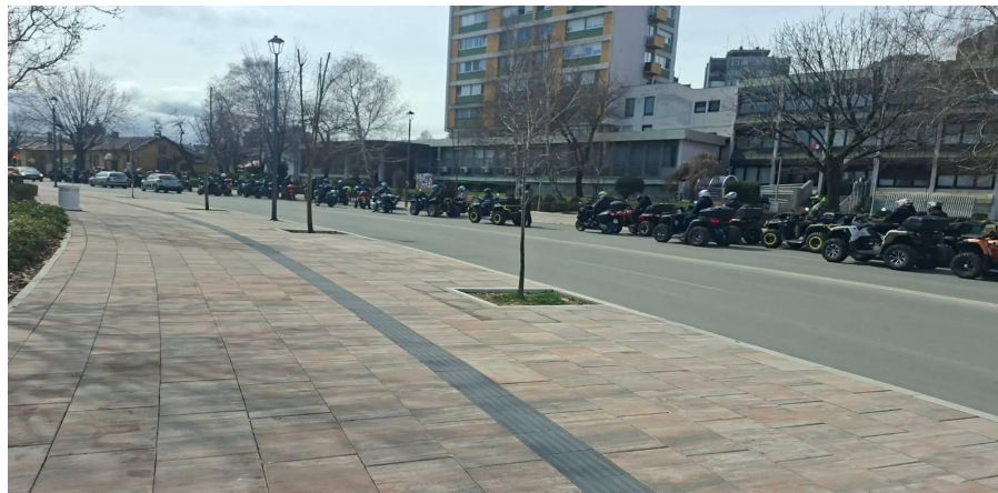
Kvadovi koji turiraju i provociraju u Boru

U popodnevним časovima primećena je i veća grupa muškaraca koja je na kvadovima i motorima kružila gradom i zadržavala se ispred sedišta opoziciono-studentske liste, praveći buku i upućujući pretnje, sa nedvosmilenom namerom da provocira i zastraši. Takvo ponašanje je dodatno pojačalo osećaj straha i napetosti među građanima.